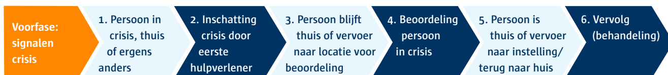
Figuur 1. Schematische weergave van stappen die personen in crisis, met (vermoeden van) acute psychiatrische stoornis, kunnen doorlopen.

Uit genoemde knelpuntenanalyse bleek dat de wachttijd vaak als veel te lang wordt ervaren. Daarom bevat de GM een triagewijzer (zie Figuur 2) met als belangrijkste verandering dat bij urgentie-categorie 2 (U2) in plaats van 2 uur een urgentie van 1 uur wordt gesteld.